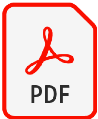
الخطة التنفيذية لجمعية محبة لعام ٢٠٢١